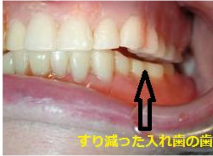
すり減った入れ歯の歯

保険で作った入れ歯はプラスチック素材を使用していますのでどうしても歯がすり減ってしまいます。噛み