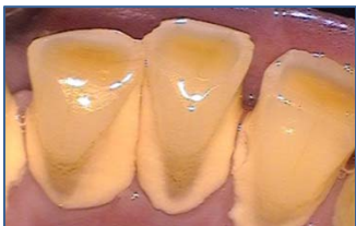
歯周ポケットに歯垢と歯石が付着した状態