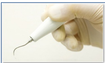
※超音波スケーラー 先端が微振動を起こし歯石を粉々に分解します

歯垢→歯ブラシでの除去可能 歯石→歯ブラシでの除去は不可能 専用器具での除去が必要