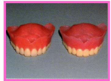
[ 完成 ]

・歯(白)と床(ピンク)の境目の曲線が再現され難い。 ・元の入れ歯との微妙なズレがある。そのまま使用すると痛みをとまなうため大抵作製後にクッション材を敷きます。