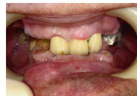
歯周病は歯の欠損など様々な弊害を誘発します。

基本的にはこのようなしくみになります。ただ、障害をお持ちの方に限っては、通常の病院受診同様の取り扱いとなります。また、よく御問い合わせ頂く事はいくつか抜粋させていただきますので、ご参照下さい。